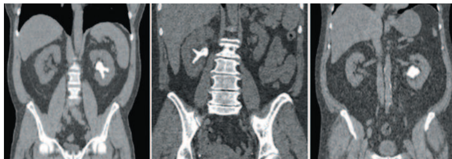
A - острый угол

Статистический анализ выполнялся, используя программы PAST ( http://folk.uio.no/ohammer/past/ ), XLStat ( http://www.xlstat.com/en/ ) и MetaboAnalyst ( http://www.metaboanalyst.ca/faces/ModuleView.xhtml ) [11]. Мы реализовали подсчет Байесовских доверительных интервалов для пропорций (чувствительность (Se), специфичность (Sp), положительная предсказательная ценность (PPV) и отрицательная предсказательная ценность (NPV)). Статистическая значимость наблюдаемых эффектов проверялась значением p и доверительными интервалами. Для выражения клинической важности использовался размер эффекта. Мерой размера эффекта использовалась площадь под кривой (AUC). Значения порядка 0,001 расценивались как статистически значимые. ■