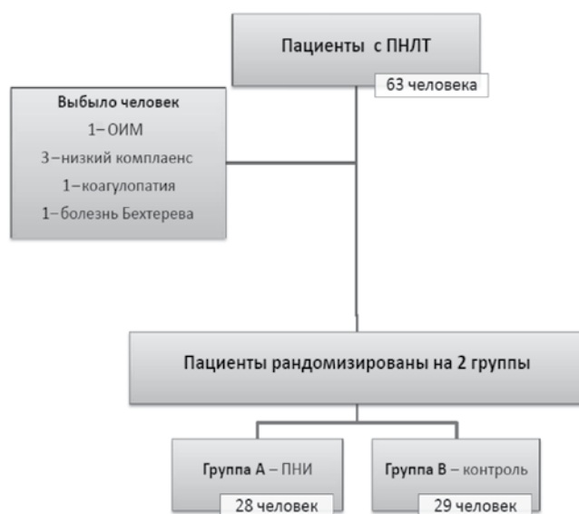
Рис. 1. Дизайн исследования: ПНЛТ — перкутанная нефролитотрипсия; ПНИ — паранефростомическая инфильтрация; ОИМ — острый инфаркт миокарда

Рандомизация осуществлялась с использованием программы — генератора случайных чисел, для сокрытия использовался метод закрытых конвер-